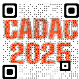
Table ronde « Être ou Paraître »